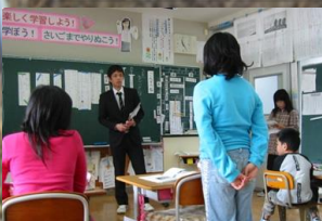
平成26年度 へき地実習受入校